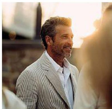
Nella foto grande, Brunello Cucinelli durante il discorso nell'anfiteatro di Solomeo. Sopra, Patrick Dempsey e l'imprenditore con Martha Stewart. Sotto, Eva Herzigova in un momento della sfilata