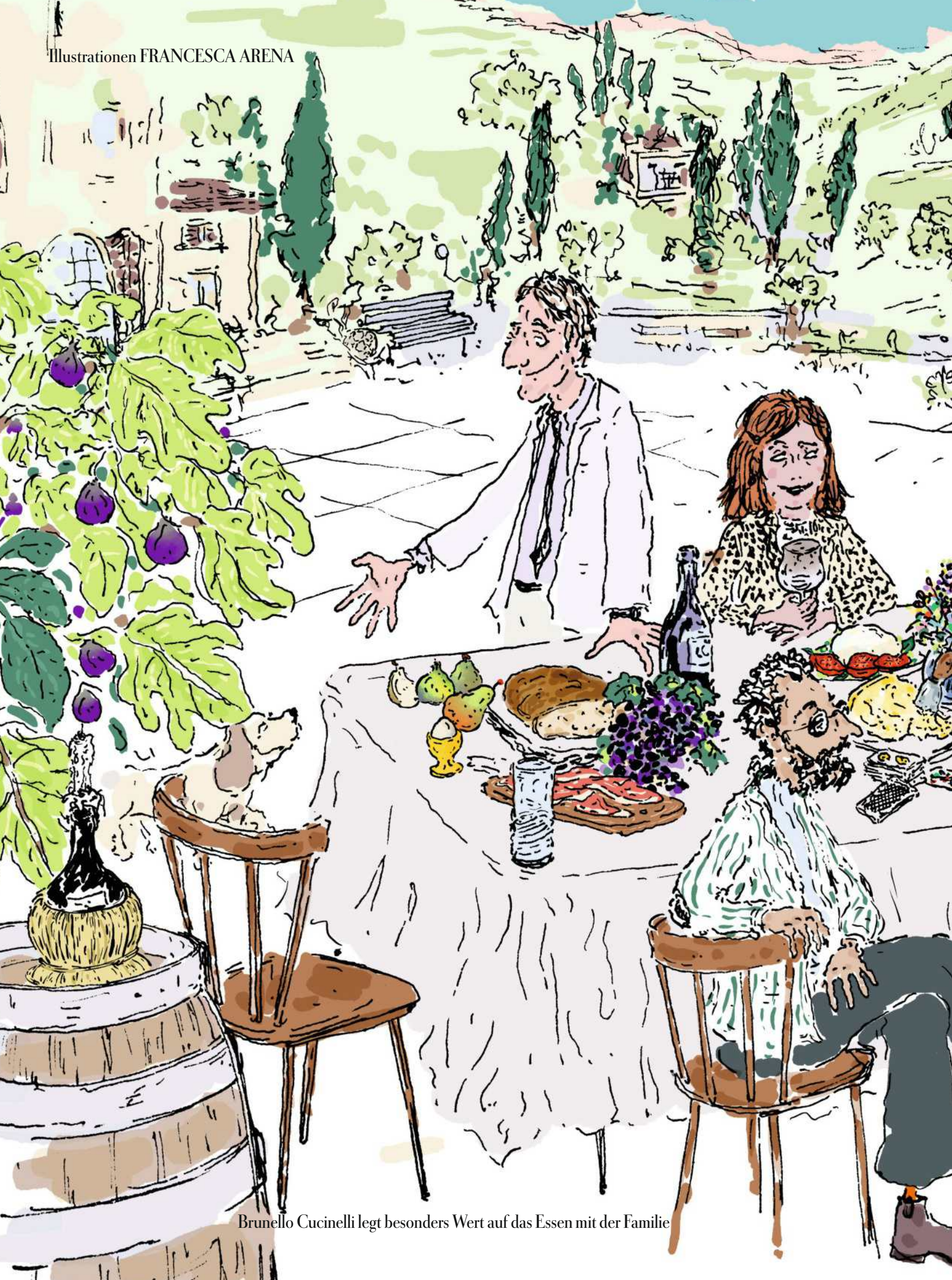
Brunello Cucinelli legt besonders Wert auf das Essen mit der Familie